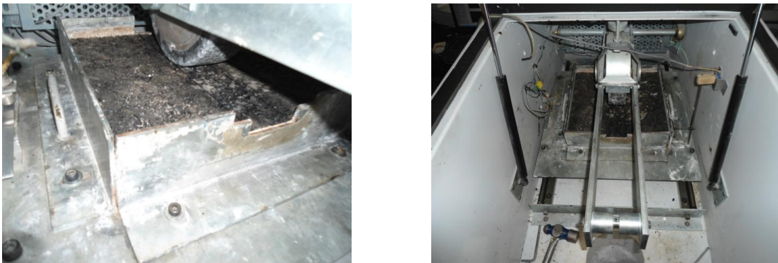
Fig.2. Ensaio de pista ou Wheel Tracking Test

Para a avaliação experimental da resistência ao rolamento, recorreu-se ao ensaio de pista (conhecido na terminologia anglo-saxónica por Wheel Tracking Test ), um ensaio simples que simula o rolamento de uma roda num pavimento rodoviário. Embora este ensaio tenha convencionalmente outro fim, pode-se de forma simplificada realizar algumas analogias entre o consumo de energia necessária para o movimento da roda, e a variação das condições de circulação, nomeadamente as características de superficiais do pavimento.