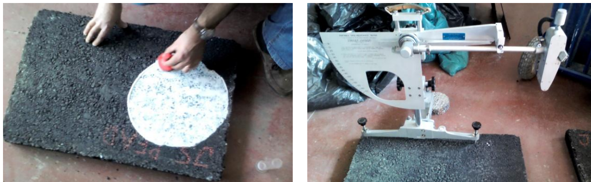
Fig.4. Ensaio da mancha de areia e pêndulo britânico

cada superfície, sendo estes valores designados por Pendulum test value (PTV). Os valores da PMT e do PTV encontram-se apresentados no Quadro 2.