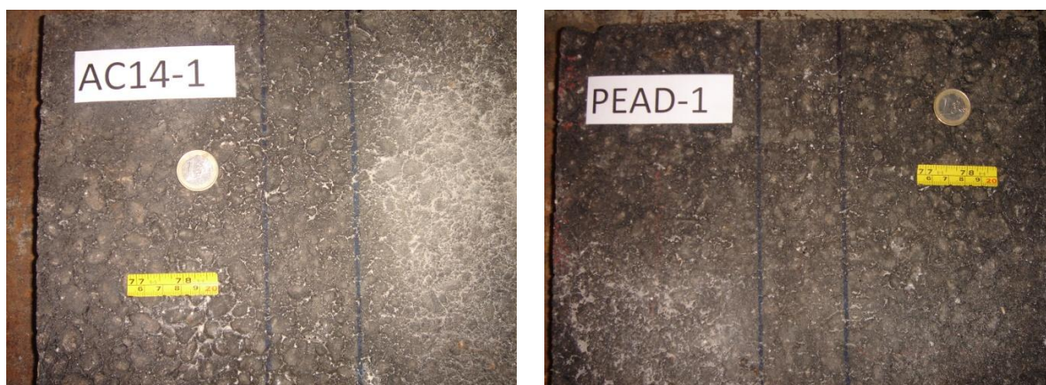
Fig.3. Aspeto da superfície das lajetas resultantes das misturas betuminosas

Na Fig.3 podem visualizar-se as superfícies das diferentes lajetas das misturas betuminosas produzidas, antes da realização dos ensaios de pista.