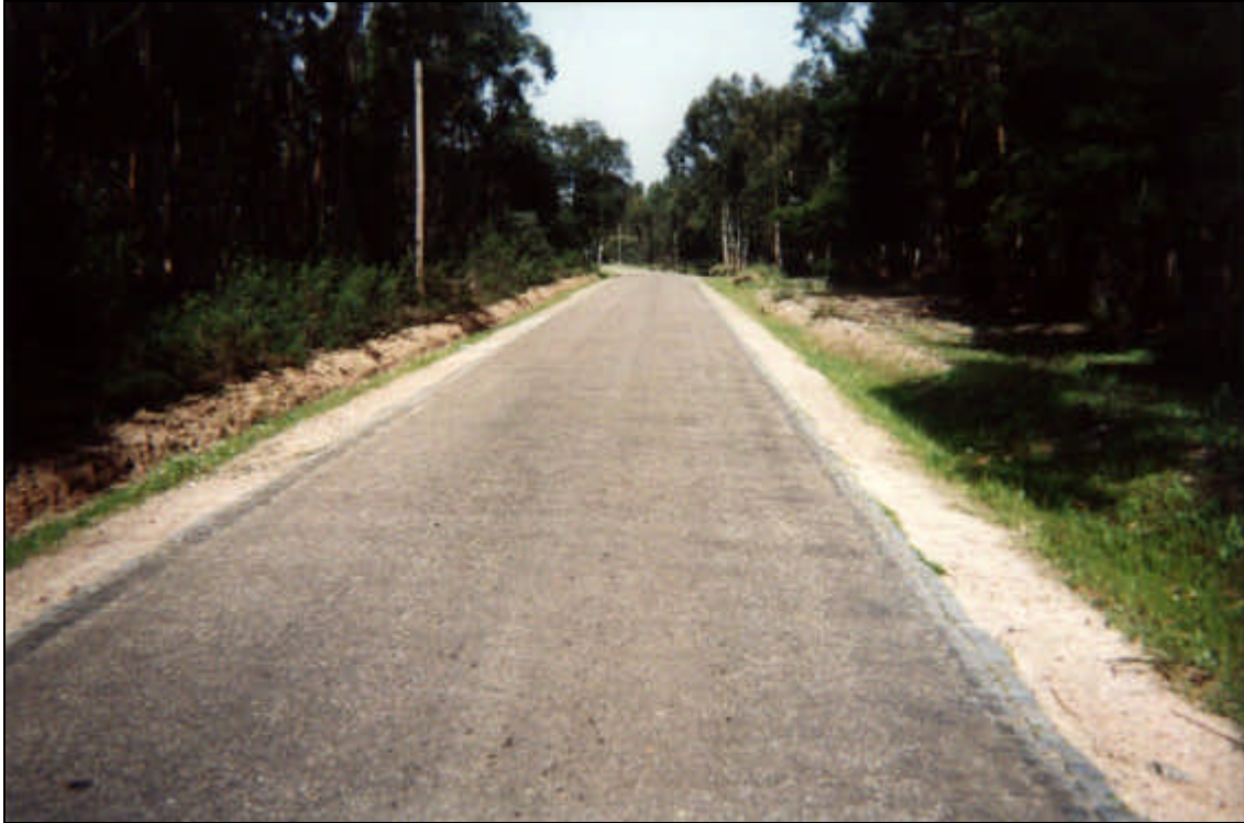
Figura 3 – Exemplo do estado das valetas com vegetação