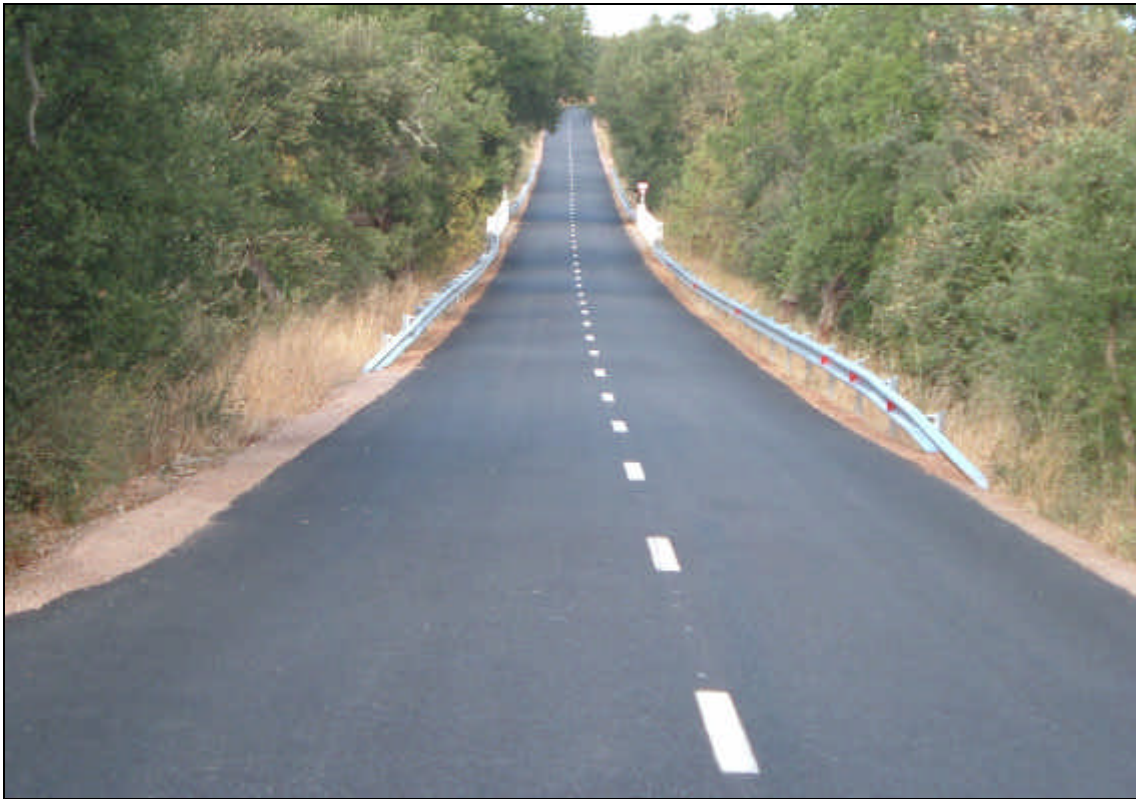
Figura 6 – Vista geral das marcações horizontais e guardas de segurança