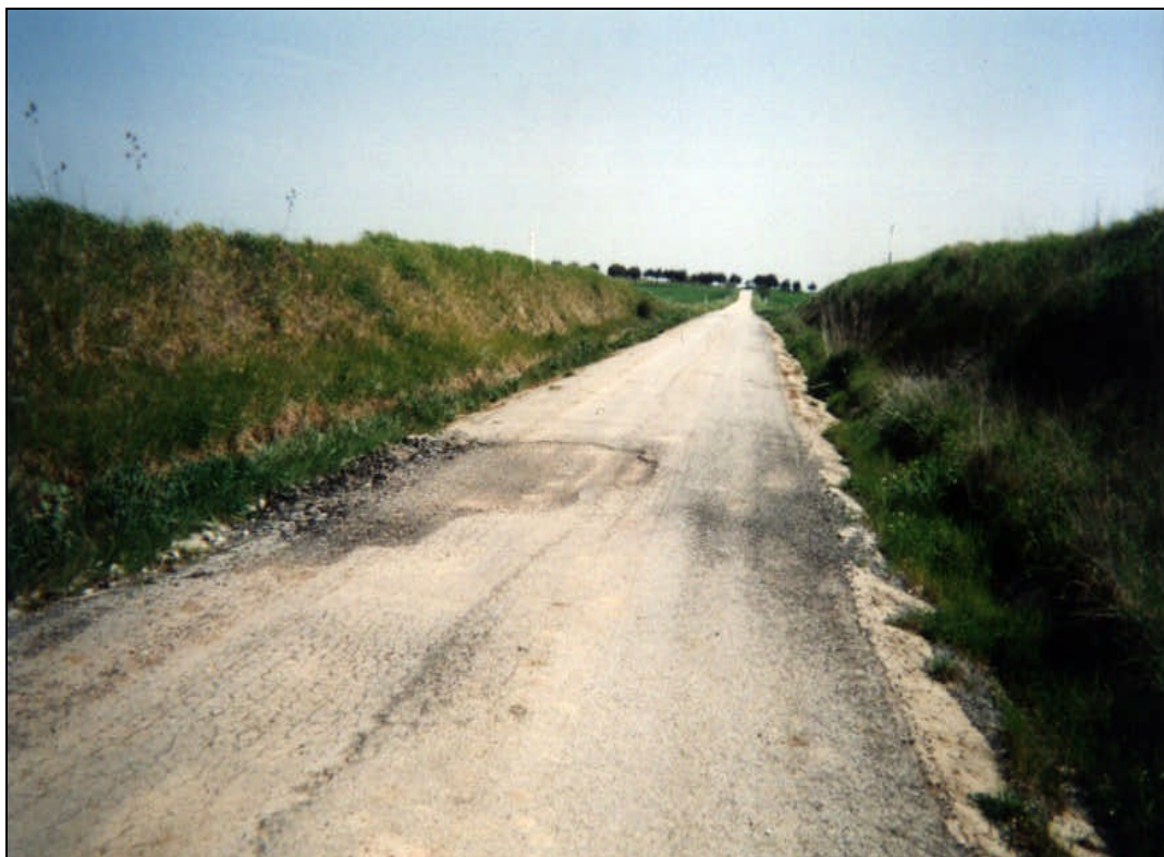
Figura 2 – Pele de crocodilo e buracos no pavimento