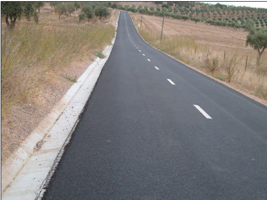
Figura 5 – Aspecto geral do pavimento e da drenagem longitudinal

Nas figuras seguintes apresentam-se algumas fotografias das estradas, após a conclusão dos trabalhos de beneficiação.