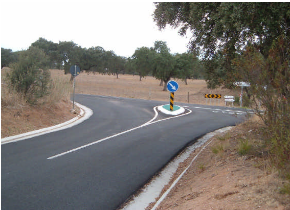
Figura 7 – Aspecto geral de um entroncamento reformulado