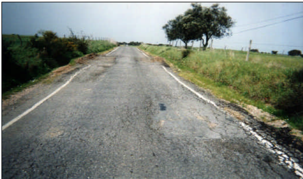
Figura 1 – Pavimento deformado devido a deficiência de drenagem

Nas figuras seguintes apresentam-se alguns exemplos destas degradações: